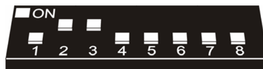
Rys. 2. Przykład ustawienia mikroprzełączników typu DIP-switch.

Przełączniki 6 i 7 muszą być ustawione w pozycji OFF.