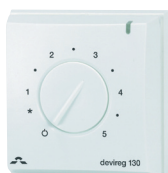
Devireg™ 130 falon kívüli

Devirail™: Fehér, vagy króm, törölköző tartó-szárító 3 méretben (U-20W, S-40W, M-60W).