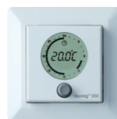
Devireg™ 550 intelligens időzítővel

A DEVI rendszereinek használatával lakásának komfortja egyszerűen, könnyedén növelhető. Forduljon bizalommal a termék forgalmazójához, aki készsággal áll rendelkezésére, és segít a megfelelő megoldás kiválasztásában.