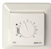
Devireg™ 530 süllyesztett