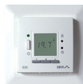
Devireg™ 535 programórával