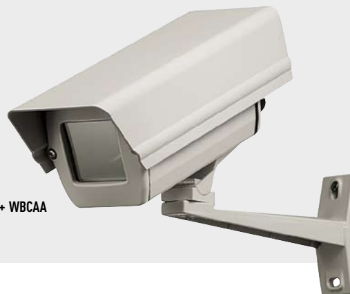
HET16K + WBCAA