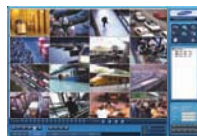
Network management S/W