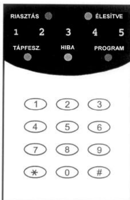
1. ábra A CA-5 vezérlopanel LED-kijelzős vezérlojének áttekintése

A védelmi rendszer állapotára vonatkozóan a billentyűzet szolgáltat információt 10 db LED és hallható hangjelzések segítségével.