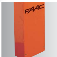
■ Öntartó sorompótest