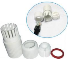
GNT-5313Borító Négy készlet vízálló burkolat (opcionális)