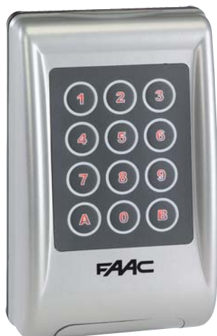
868 SLH RÁDIÓS KEZELŐ