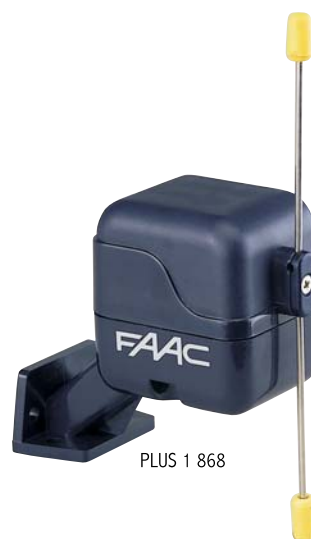
PLUS 1 868